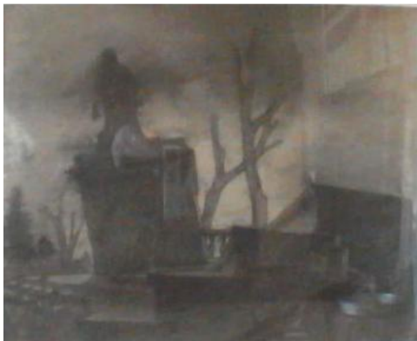
Каплуновский В.П. Эскиз декорации. Петергоф. Фильм «Два бойца». Реж. Луков Л.Д. Ташкентская киностудия. 1943 Бумага, карандаш графитный, акварель. 28,5x35,5 ГЦМК КП-494. И-372